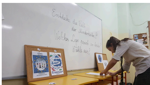
Logo-Wahl in Ruse (Bulgarien)

Hier sehen Sie einige Bilder von den Logo-Wahlen: