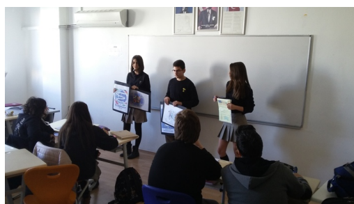
Logowahl in Izmir (Türkei)