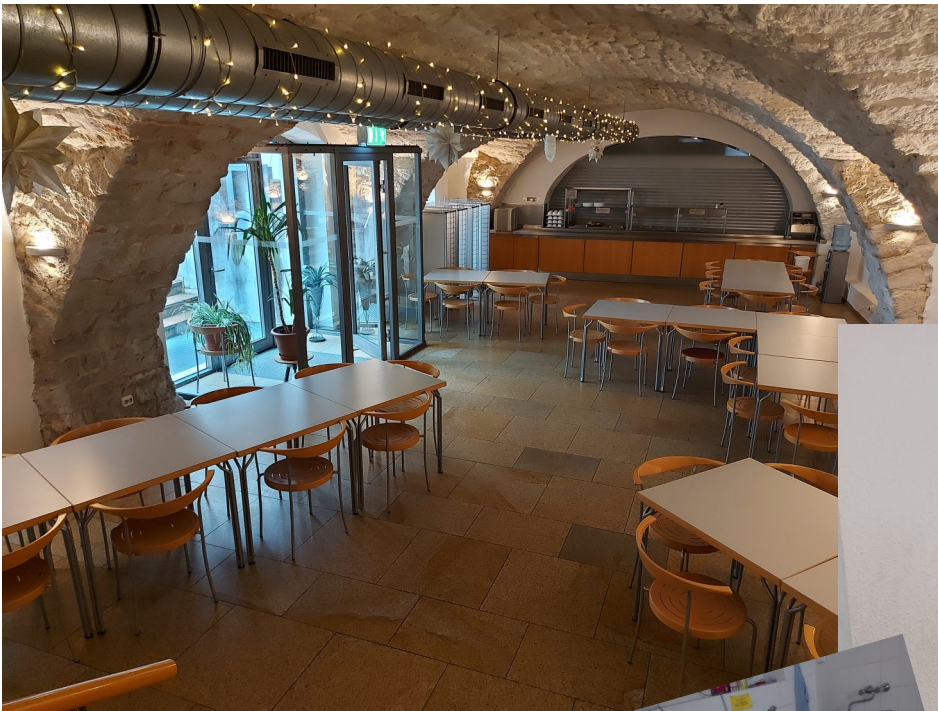
Mensa und Miniküche (unten)