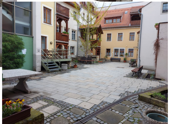
Kleiner (oben) und großer Innenhof