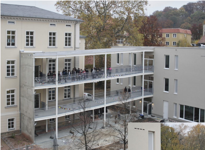
Oben: Blick auf den Übergang in den neuen Anbau.